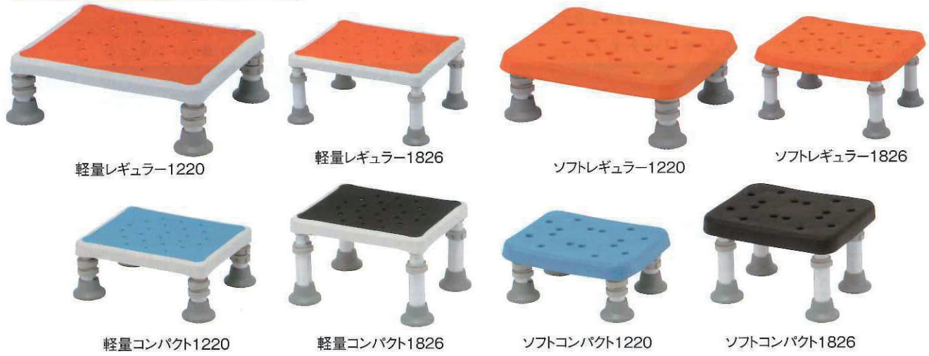
軽量レギュラー1220 軽量レギュラー1826 ソフトレギュラー1220 ソフトレギュラー1826 軽量コンパクト1220 軽量コンパクト1826 ソフトコンパクト1220 ソフトコンパクト1826