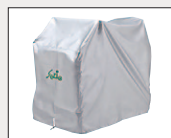
車体カバー(遊歩用) 希望小売価格 3,780円 (消費税抜 3,500円)