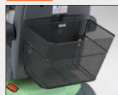
リヤバスケット 希望小売価格 7,560円 (消費税抜 7,000円)