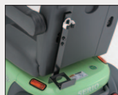
四点杖ホルダー 希望小売価格 10,800円 (消費税抜 10,000円)