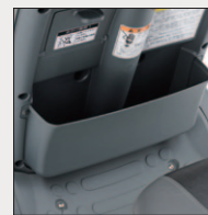
フロントポケット