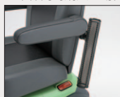
ステッキホルダー 希望小売価格 4,320円 (消費税抜 4,000円)