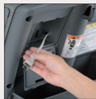
家庭用コンセント で簡単充電