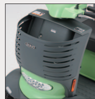
大型フロント バスケット