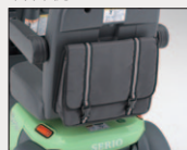
リヤバッグ 希望小売価格 9,720円 (消費税抜 9,000円)