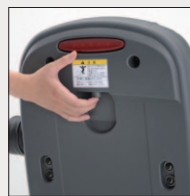
電磁開放式 クラッチ