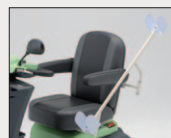
松葉杖ラック 希望小売価格 9,720円 (消費税抜 9,000円)