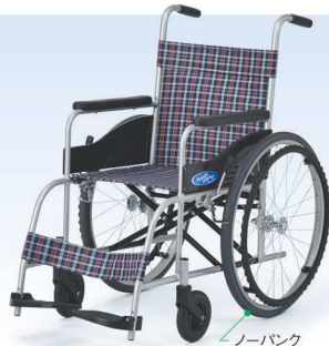
ノーバンク (ハイポリマー)タイヤ

NEO-0 00175-000321 56,000円(非課税) 耐荷重100kg