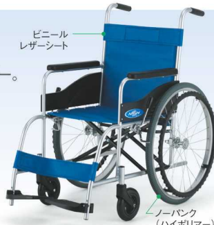
ビニールレザーシート