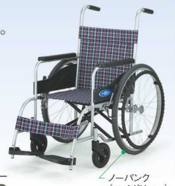
ノーバンク (ハイポリマー)タイヤ