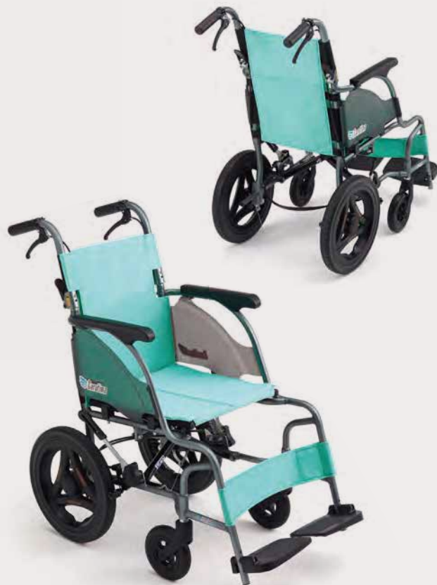
シートカラー：グリーン