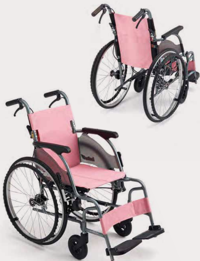
シートカラー：ピンク